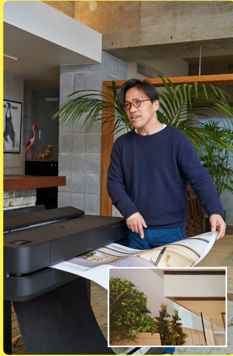
外観のパースを半光沢紙（A1）で出力。外壁の色味やテクスチャを忠実に再現しているほか、植栽のグリーンも鮮やかに表現されており、設計意図の共通認識が得やすい。プレゼンの説得力も高まる